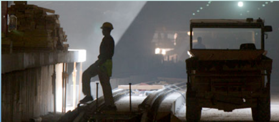
Foto del mes | Obras de soterramiento del ferrocarril en Palma de Mallorca