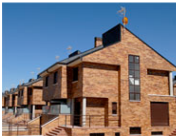
Viviendas Los Carrizos

El conjunto Ciudad Jardín, consta de 137 viviendas distribuidas en 21 portales, garajes y trasteros, constituidas por planta sótano, planta baja y tres alturas.