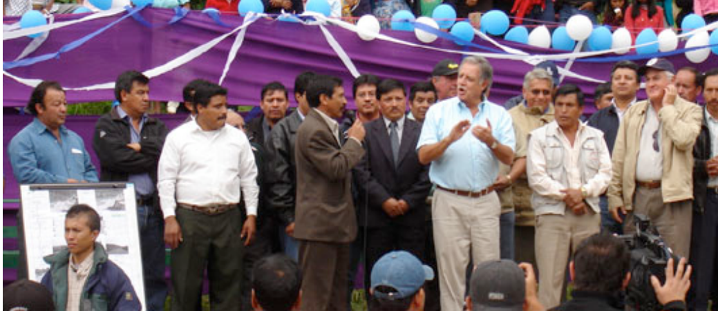
En la imagen, con camisa azul, el Presidente de Guatemala, Oscar Berger, durante el acto de inauguración de la Ruta.