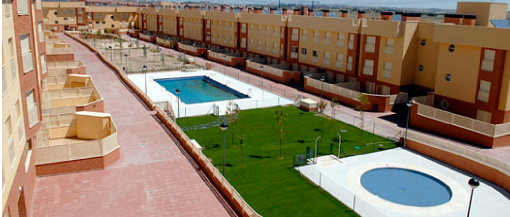
Viviendas Ciudad Jardín